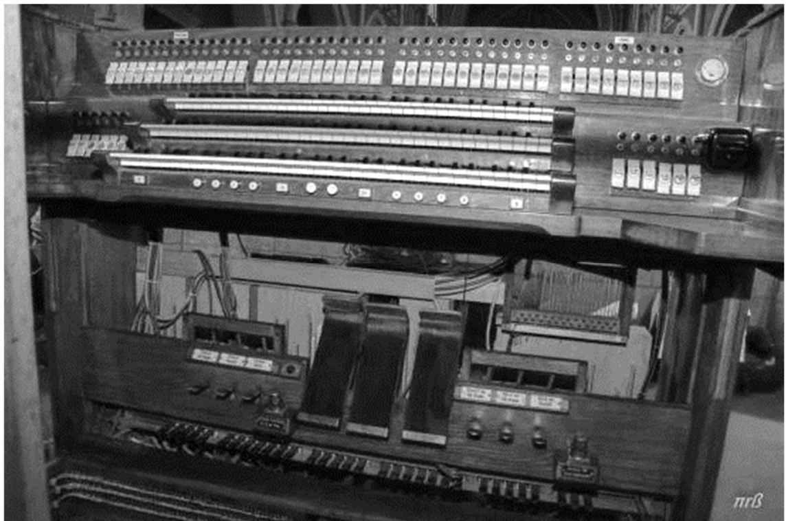
La console après restauration